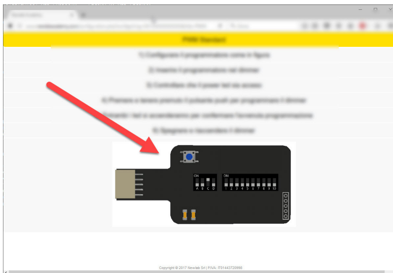
ESEMPIO DI CONFIGURAZIONE DEL L392MA - FIGURA N. 2