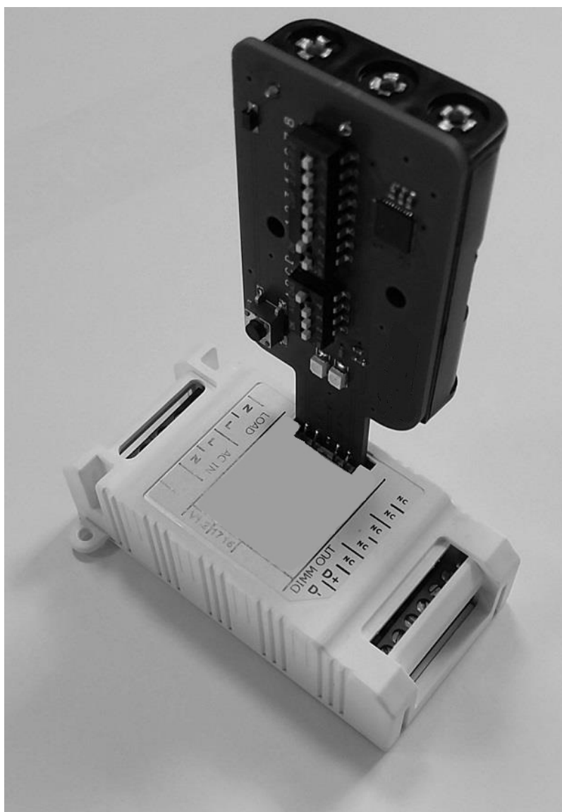
PROGRAMMAZIONE DEI DEVICE TRAMITE L392MA - FIGURA N. 3